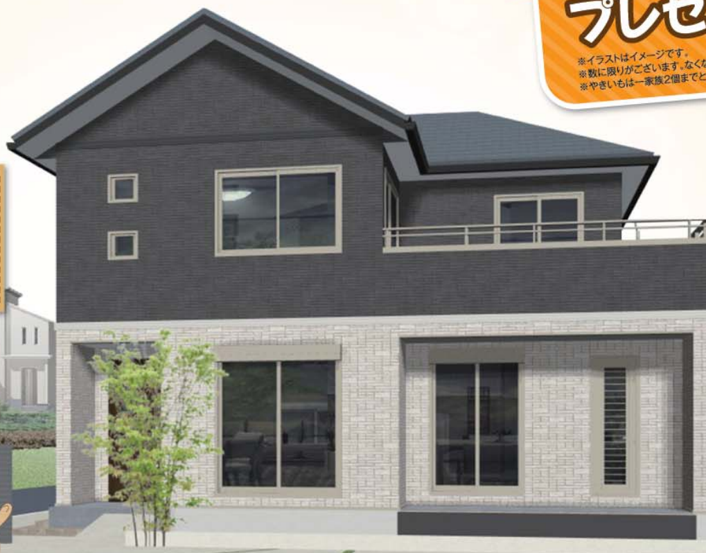
※実際にご覧いただく建物のイメージです。