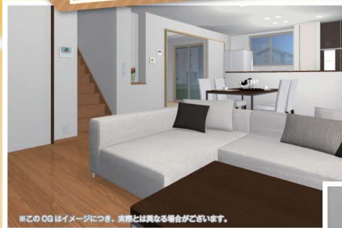
※このCGはイメージにつき、実際とは異なる場合がございます。